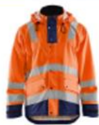
Regnjakke 2-farvet (orange/marine) Klasse 3

OBS overdelen skal være lynet/lukket for at opnå en klasse 3!