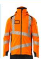
Vinterjakke Fås også i dame Klasse 3