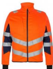
Arbejdjakke/sommerjakke 2-farvet (orange/marine) Klasse 2