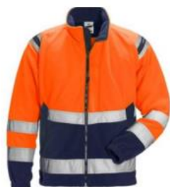
Fleecejakke 2-farvet (orange/marine) Klasse 2