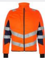
Arbejdsjakke/sommerjakke 2-farvet (orange/marine) Klasse 2