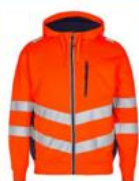
Hættetrøje (orange) Fås også i dame Klasse 3