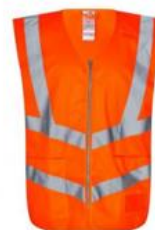
Vest orange Klasse 2