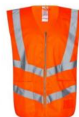
Vest orange Klasse 2