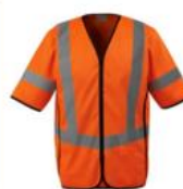
Vest (orange) Klasse 3