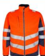
Softshelljakke (orange) Fås også i dame Klasse 3