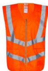
Vest orange Klasse 2